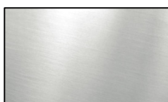
SCOTCH BRITE -A1